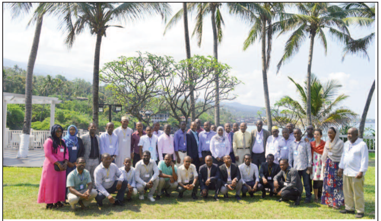
Participants_atelier_avant projet du code.

Par ailleurs, il a été constaté une insuffisance de la législation et de la réglementation dans les domaines vétérinaires et créait le plus souvent