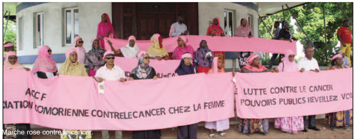
Marche rose contre le cancer.