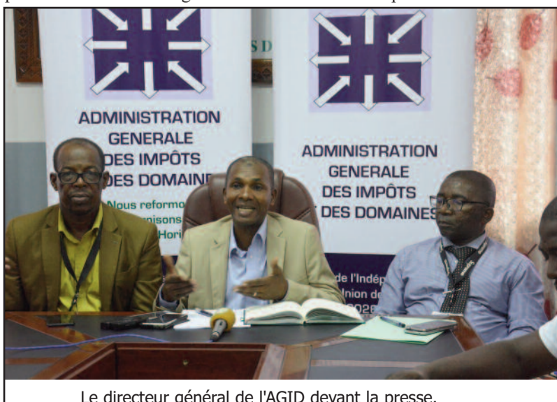
Le directeur général de l'AGID devant la presse.

Qu'Allah l'accueille dans toute sa Miséricorde.